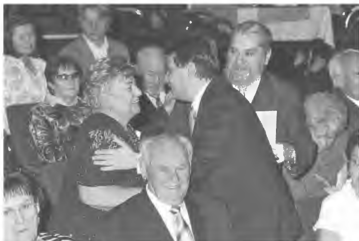
Szeretet és Hűség Napja – minden évben köszöntik a kerek házassági évfordulót ünneplő házaspárokat